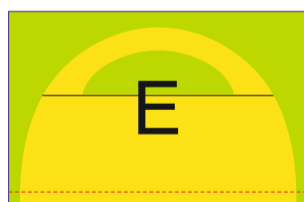
Stěna s oknem